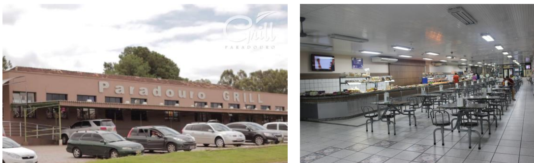
Figura 6: Paradouro Grill.