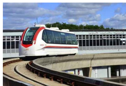
Figura 2: vista da estação aeroporto e do aeromovel.