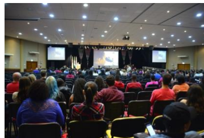
Figura 9: Vista do centro de eventos da FURG.