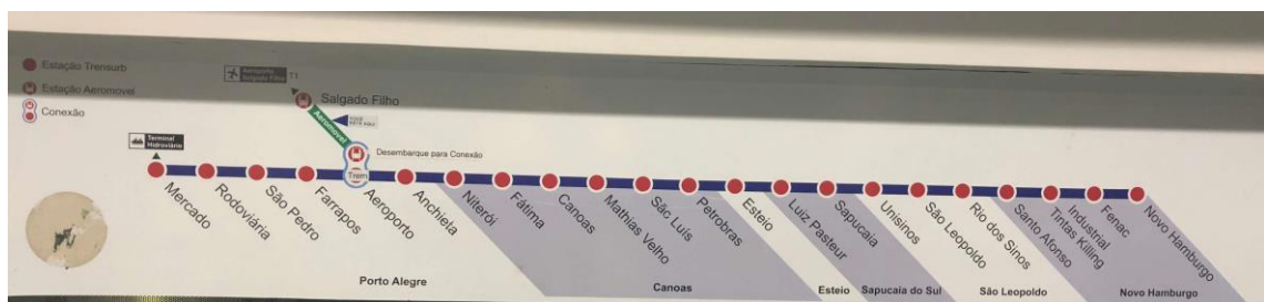
Figura 3: paradas do TRENSURB.