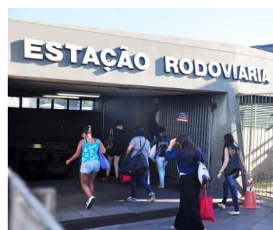
Figura 4: Vista do TRENSURB e da Estação rodoviária.

Obs: o tempo de viagem, do momento em que você embarcou no trem, é de 5min a 8 min. Pegar o trem no SENTIDO MERCADO e SALTAR na ESTAÇÃO RODOVIÁRIA. Caso você tenha muita bagagem, essa pode não ser uma boa opção. Evite os horários de pico, pois o TRENSURB provavelmente estará lotado.