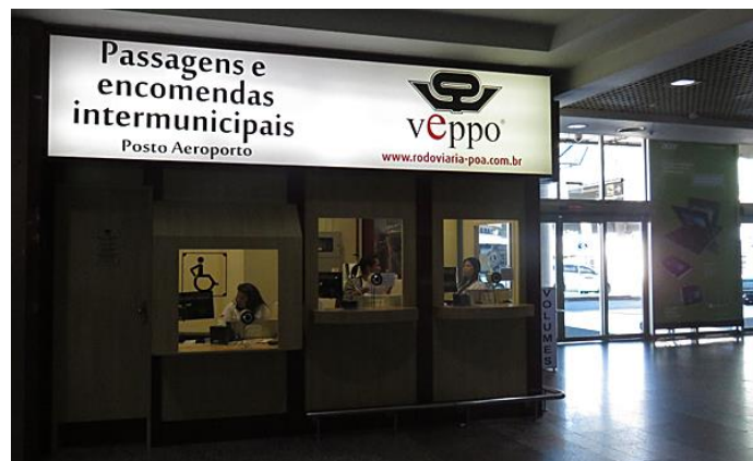
Figura 1: Guichê da VEPPPO no aeroporto salgado Filho em Porto Alegre.

Prezado congressista, no aeroporto Salgado Filho em Porto Alegre é possível comprar a passagem de ônibus do trecho Porto Alegre – Rio Grande já no aeroporto. Ao sair do desembarque siga pela direita onde, no outro lado do saguão você enxergará um guichê da VEPPPO. O horário de funcionamento do guichê no aeroporto é de 08hs às 21hs, diariamente.